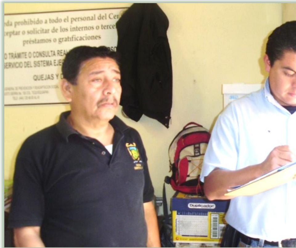
Supervisión CEREDI Cerritos, S.L.P. Mayo de 2009

e) Irregularidades penitenciarias: Corrupción, tortura, golpes, maltratos, extorsión, amenazas, sobrepoblación, tráfico de armas y drogas, segregación prolongada, etc.