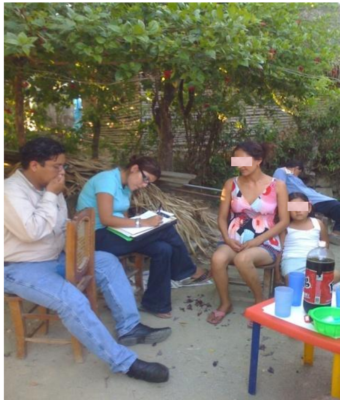
Personal de la Visitaduría recabando el dicho de la cónyuge de "AEH" El Huexco, Tampacán, S.L.P. Julio 2009.

En cada cambio de administración municipal, la Comisión a través de la Tercera Visitaduría retoma la labor de concientización con cada Presidente Municipal para la atención y debido funcionamiento de las barandillas municipales o separos preventivos.