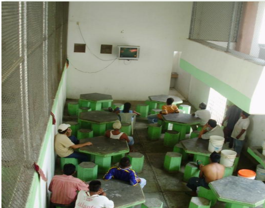
Supervisión Comedor Tamazunchale, S.L.P. Junio 2009

Los motivos de queja recurrentes de adultos y menores internos en todo el Estado son: Derecho a la legalidad y seguridad personal conceptos que comprenden escenarios de Castigo indebido; tratos crueles; lesiones; ubicación en espacios inadecuados por situación jurídica; cobros indebidos a internos; falta de atención médica; violación al debido proceso.