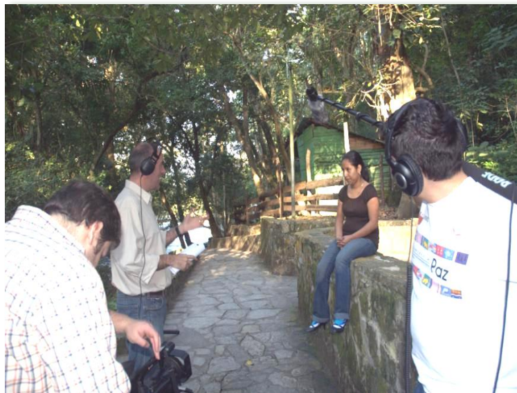
Rodaje del Documental Enaguas. Tambaque, Aquismón, S.L.P.

Tan es así, que según los resultados de la última Encuesta Nacional de la Dinámica de las Relaciones en los Hogares (ENDIRHE 2006), 67% de las mujeres en México sufrieron violencia durante el año 2006.