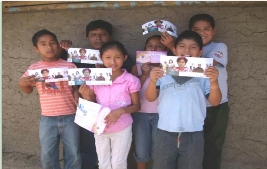
Difusores y difusoras infantiles indígenas de la Comisión Estatal de Derechos Humanos en la Huasteca Potosina.