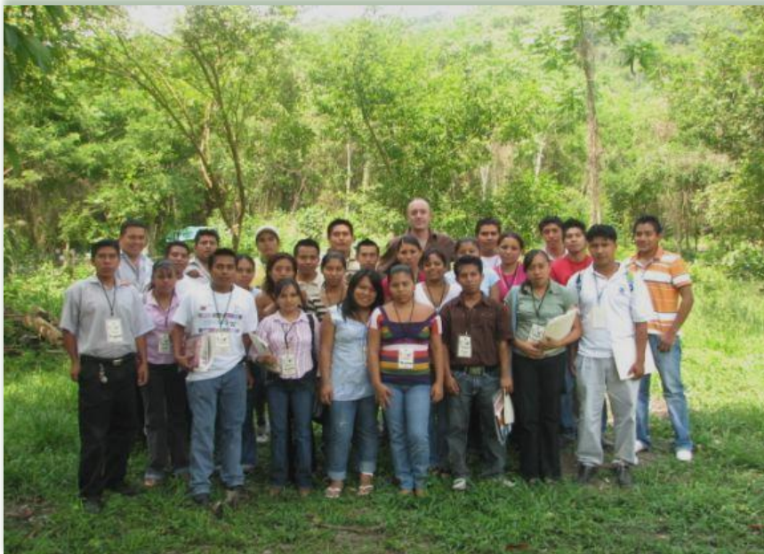
Formación de promotores indígenas de los derechos humanos. Huasteca Potosina.

Otra de las acciones es el seguimiento de comités de promotores formados durante el año 2008 y cuya función se centra en el trabajo de educación en derechos humanos para las comunidades. Estos comités de promotoras y promotores se encuentran llevando a cabo talleres de promoción de los derechos humanos y la prevención de la violencia. Al concluir estos talleres sumaremos un total de 360 talleres realizados en comunidades indígenas.