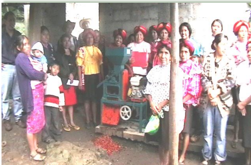
"Productoras de sueños"

Para el año 2009, el programa ESCENARIOS DE PAZ centró sus acciones en la elaboración del primer "diagnóstico participativo sobre los derechos humanos y la situación de la violencia que sufren las mujeres indígenas de San Luis Potosí." Este diagnóstico se presenta como el primero en su tipo en la historia del Estado, ya que metodológicamente se realizó a través de un planteamiento integral el cual consiste en dos vertientes: una cualitativa, que tiene que ver con la realización de talleres etiológicos y de auto-diagnóstico en diferentes comunidades elegidas mediante el trabajo de muestreo representativo; y otra cuantitativa, la cual consistió en la aplicación de un instrumento estadístico diseñado específicamente para ser aplicado en los diversos contextos culturales del Estado.